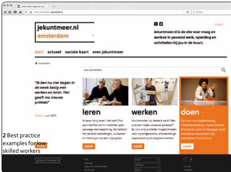
2 Best practice examples for low-skilled workers